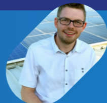
A cura di Marco Melucci