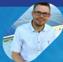
A cura di Marco Melucci

La blockchain è la tecnologia innovativa dalle innumerevoli applicazioni, fruibile in moltissimi ambiti. Si tratta di una rete informatica di nodi che gestisce in modo sicuro e univoco un registro pubblico composto da dati e informazioni, senza la necessità di un controllo centrale.